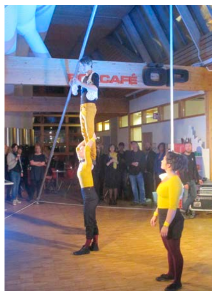
Biblioteket är så mycket mer än en samling böcker. Här är två bilder från Kulturfesten 2016 med avancerad akrobatik i pausen mellan prisutdelningarna