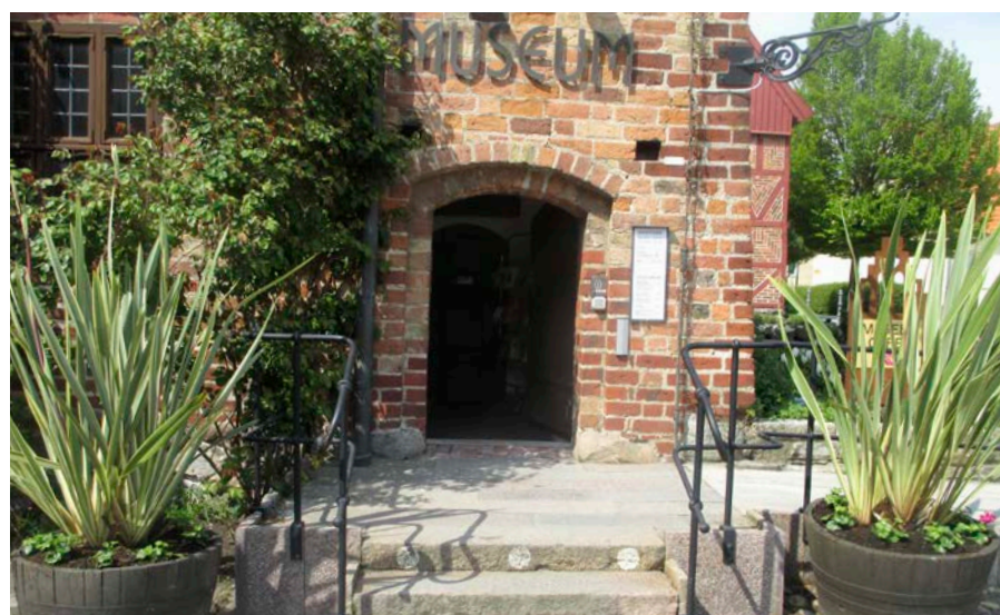
2017 fyllde Klosteret 750 år. Nu fortsätter arbetet med nya spännande utställningar som Jordens hemligheter.