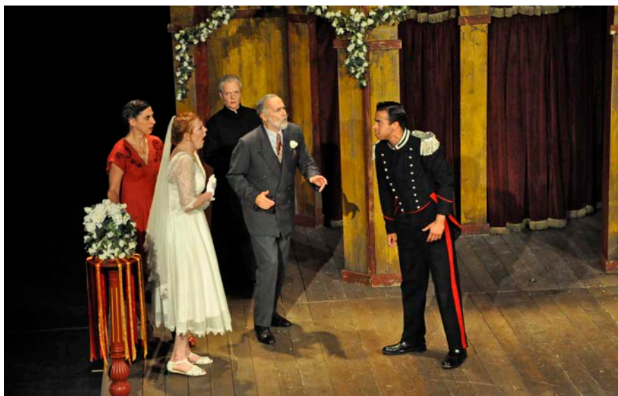
Globe Theatre från London satte upp "Much ado about nothing" av William Shakespeare