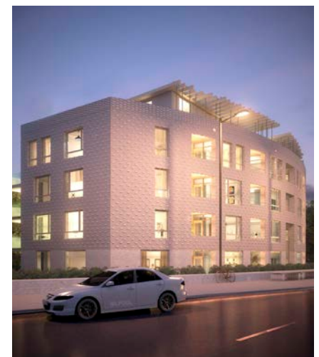
Exteriör Havsblick, kv Lichton.